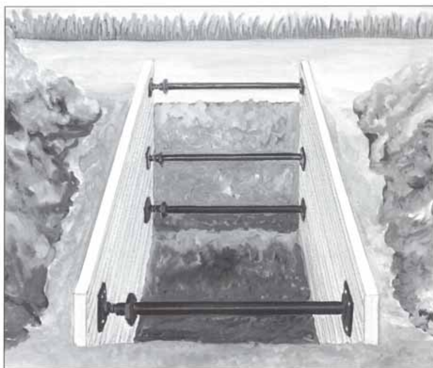
Beim Kastenverbausystem GARANT steht die Sicherheit des Menschen an erster Stelle.