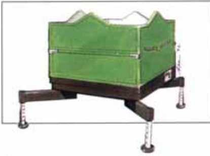
Terracont mit Palmendekor