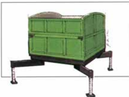
Terracont mit Rundbogen-Segmenten