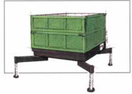
Terracont mit Rasenhaut

Nun kann kein metallisch glänzender massiver Würfel mehr die ästhetischen Empfindungen verletzen.