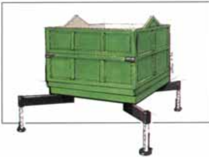
Terracont mit Giebel-Stilelementen