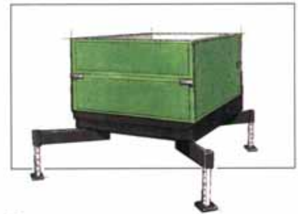
Terracont mit Rasenplattenverkleidung

Urteilen Sie selbst, ob es gelingen ist, die kalte Sachlichkeit des Materials zu mildern und die Technik menschengerechter zu gestalten.